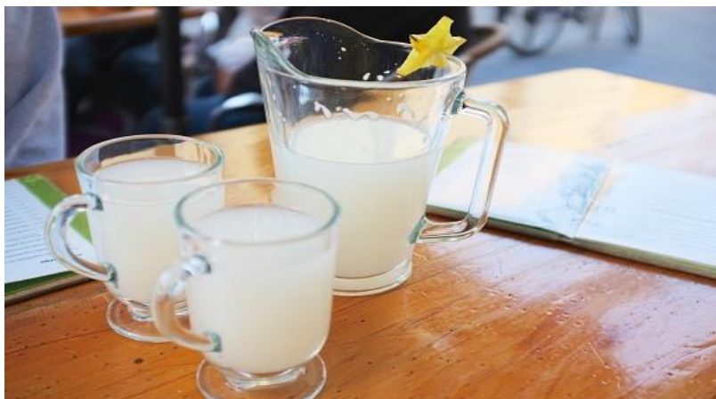
El pulque es la bebida nacional de México.

El pulque es una refrescante bebida tradicional mexicana muy poco conocida en el resto del mundo. ¿Conoces algún tipo de bebida parecida en tu país? ¿Cuál es tu bebida favorita? ¿Contiene alcohol? ¿La pueden beber también los niños?