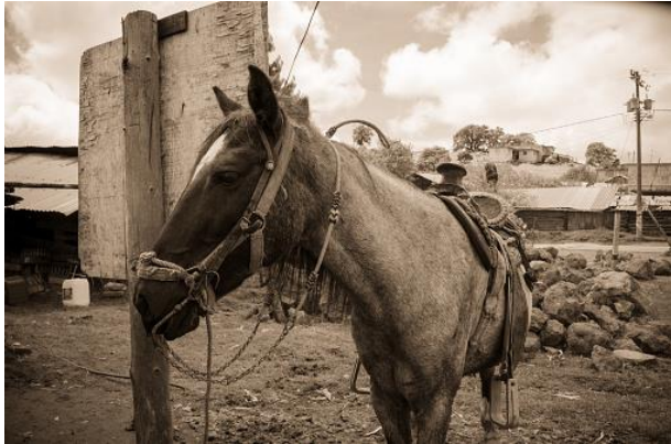
Un caballo en un pueblo de Oaxaca.