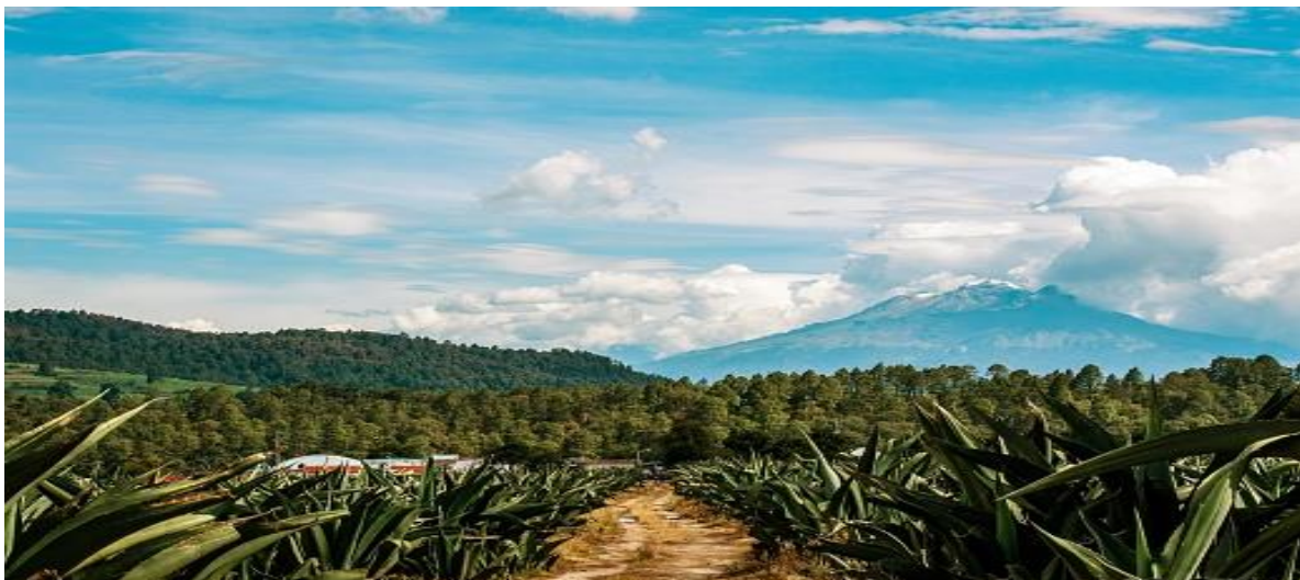
Un campo de agave en Oaxaca.

Inhalt: Die Menschen im mexikanischen Bundesstaat Oaxaca verdienen ihr Geld mit Pulque, einem traditionellen Getränk, das aus der Agavenpflanze gewonnen wird. Doch das als heilig angesehene Getränk ist in Gefahr – und soll durch Tourismus gerettet werden. Dabei handelt es sich aber nicht um den üblichen Massentourismus, der die Küsten und Strände Mexikos berühmt gemacht hat, sondern um nachhaltigen Tourismus, der die Kultur der Ureinwohner respektiert und bewahrt. Es geht darum, dem Land und den Bauern direkt etwas zurückzugeben, ohne Umwege und aus erster Hand. Die Erfahrung von Natur und Geschichte soll lebendig und unmittelbar sein.